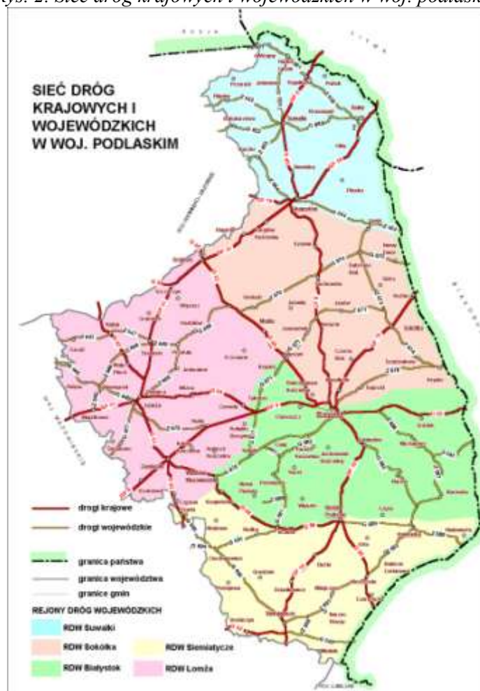
Rys. 2. Sieć dróg krajowych i wojewódzkich w woj. podlaskim