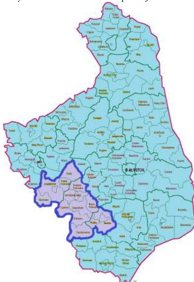
Rys. 1. Położenie LGD na mapie województwa