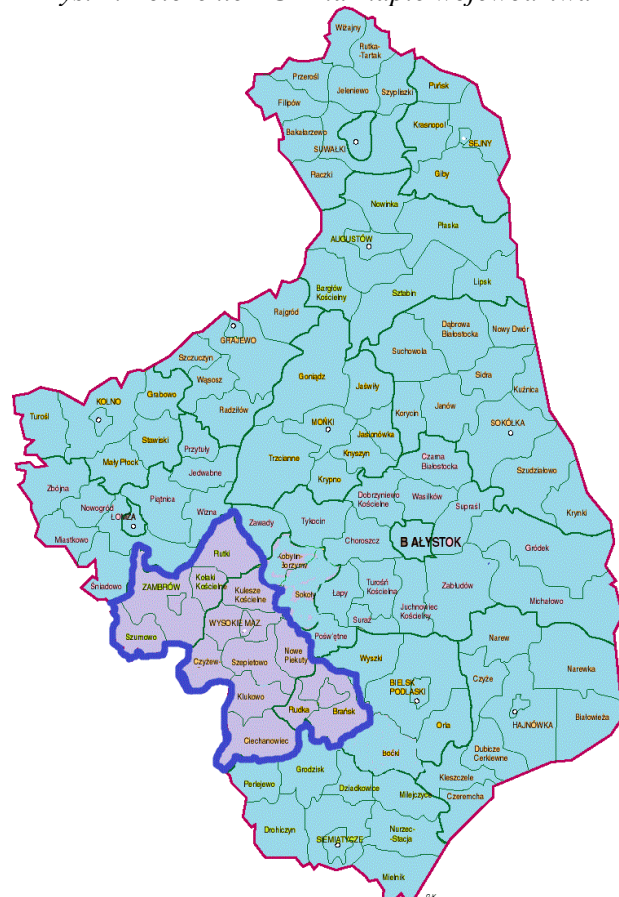
Rys. 1. Położenie LGD na mapie województwa